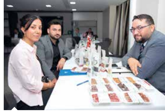
İngiltere Yurt Dışı Pazarlama Faaliyeti'ne UR-GE projesine dâhil olan 17 firmadan 24 temsilci katıldı.

potansiyel alıcı muhataplarıyla buluşarak, Birleşik Krallık'ta pazar paylarını artıracak temaslar gerçekleştirdi. Etkinliğin son gününde AHBİB heyeti, zincir marketleri ziyaret ederek yerel ürünler ve piyasa hakkında bilgi edindi.