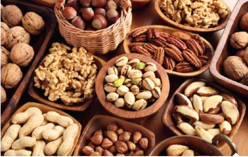
Elnas Nuts Gıda, Mersin ve İran'da kuruyemiş işleme yatırımlarıyla üretim kapasitesini artırdı.

Mersin merkezli Elnas Nuts Gıda; ABD, Vietnam, Arjantin, Çin, İran, Rusya ve Suudi Arabistan'daki ofisleriyle uluslararası pazarlarda etkinliğini sürekli artırıyor. Mersin Serbest Bölge'de ve İran'ın Sirjan şehrinde kabuklu Antep fıstığı kırma ve Antep fıstığı içi çıkarma tesislerini bu yıl devreye alan Elnas Nuts Gıda, Orta Doğu, Kuzey Afrika ve Avrupa ülkeleri ile Rusya ve Çin'e ihracat gerçekleştiriyor.