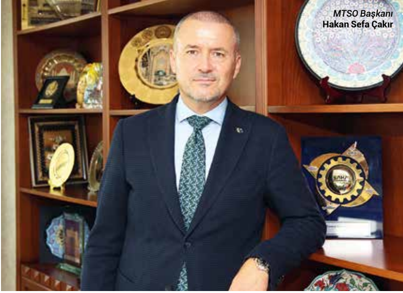
MTSO Başkanı Hakan Sefa Çakır