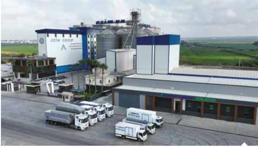
Türkiye'nin en büyük sanayi kuruluşları listesinde yer alan Azim Group Holding, ülke ekonomisine 26 yıldır güç veriyor.

Dünya un ihracatında lider konumda bulunan Türkiye'yi küresel arenada başarıyla temsil eden Azim Un, "El Değmeden Üretim" ilkesiyle, modern üretim tesislerinde ürettiği 28'i aşkın ürünü ağırlıklı olarak Orta Doğu ülkelerine ihraç ediyor. Mardin ve Adana'daki fabrikalarında günlük 1.250 ton üretim kapasitesine ulaşan Azim Un, kalite ve randımanı artırmak adına ÜR-GE çalışmalarına büyük önem veriyor.